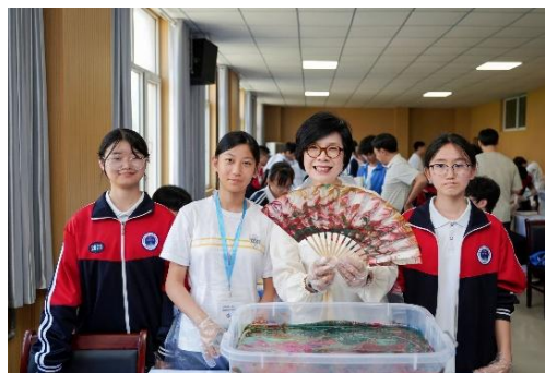
冀港兩地姊妹學校師生代表在贊皇中學教學樓前合影。中華電力企業發展總裁莊偉茵女士與香港和河北師生共同製作非遺漆扇。